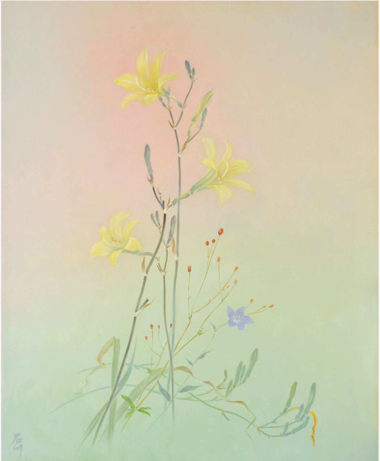
Koichi Ishikawa 《Yusuge (Asamakisuge)》1996 c/o 15F